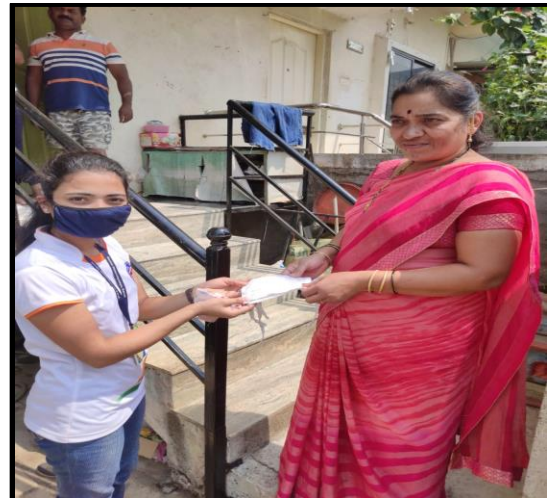
सॅनिटाइजरचे मोफत वाटप करताना स्वयंसेविका