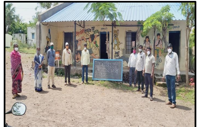
कोरोना चाचणी शिबिर